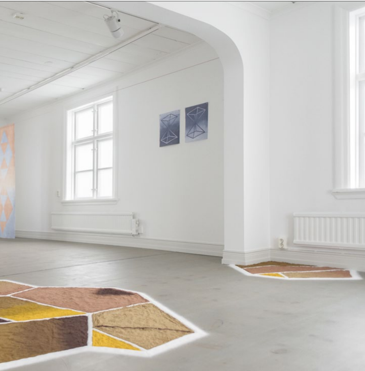
currysås, björnbär och lökskal. På bilden syns en installation skapad av kryddor och malda rotsaker.